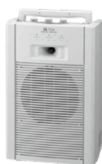
ワイヤレスアンプ