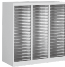
トレーキャビネット