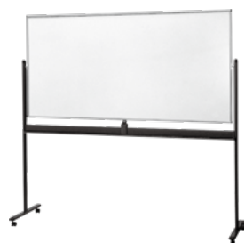
両面ホワイトボード