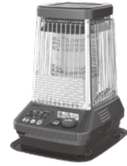
ブルーヒーター [小]