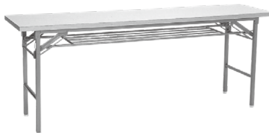
会議テーブル ホワイトオーク