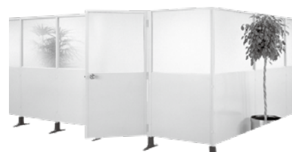
ドアパーテーション