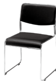
ミーティングチェア