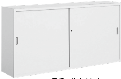
スチールカウンター