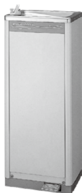
足踏ウォータークーラー