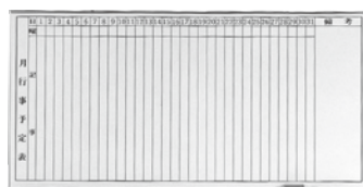
ホワイトボード行事